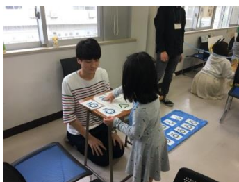
神経衰弱トランプゲーム