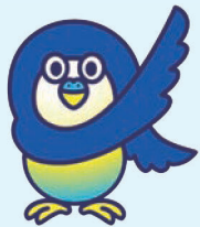
ケイヨウキンコウのケイヨウインコ