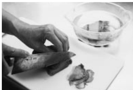
塩出しのやり過ぎに注意