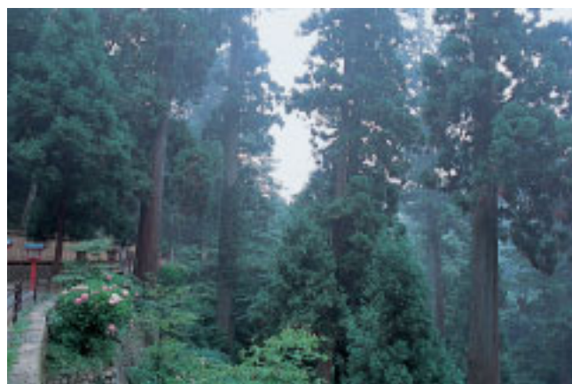
天狗が現われそうな幽玄な雰囲気、杉並木