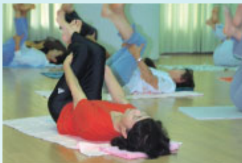
それぞれの動きにそれぞれの意味があります