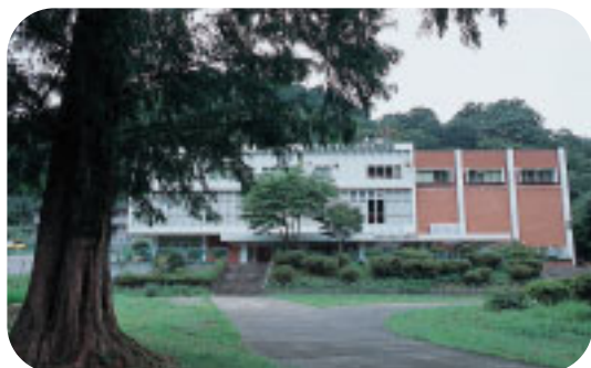
ふもとにある東京都高尾自然科学博物館。自然観察会や自然講座も開催しています（第1・3月曜休館）