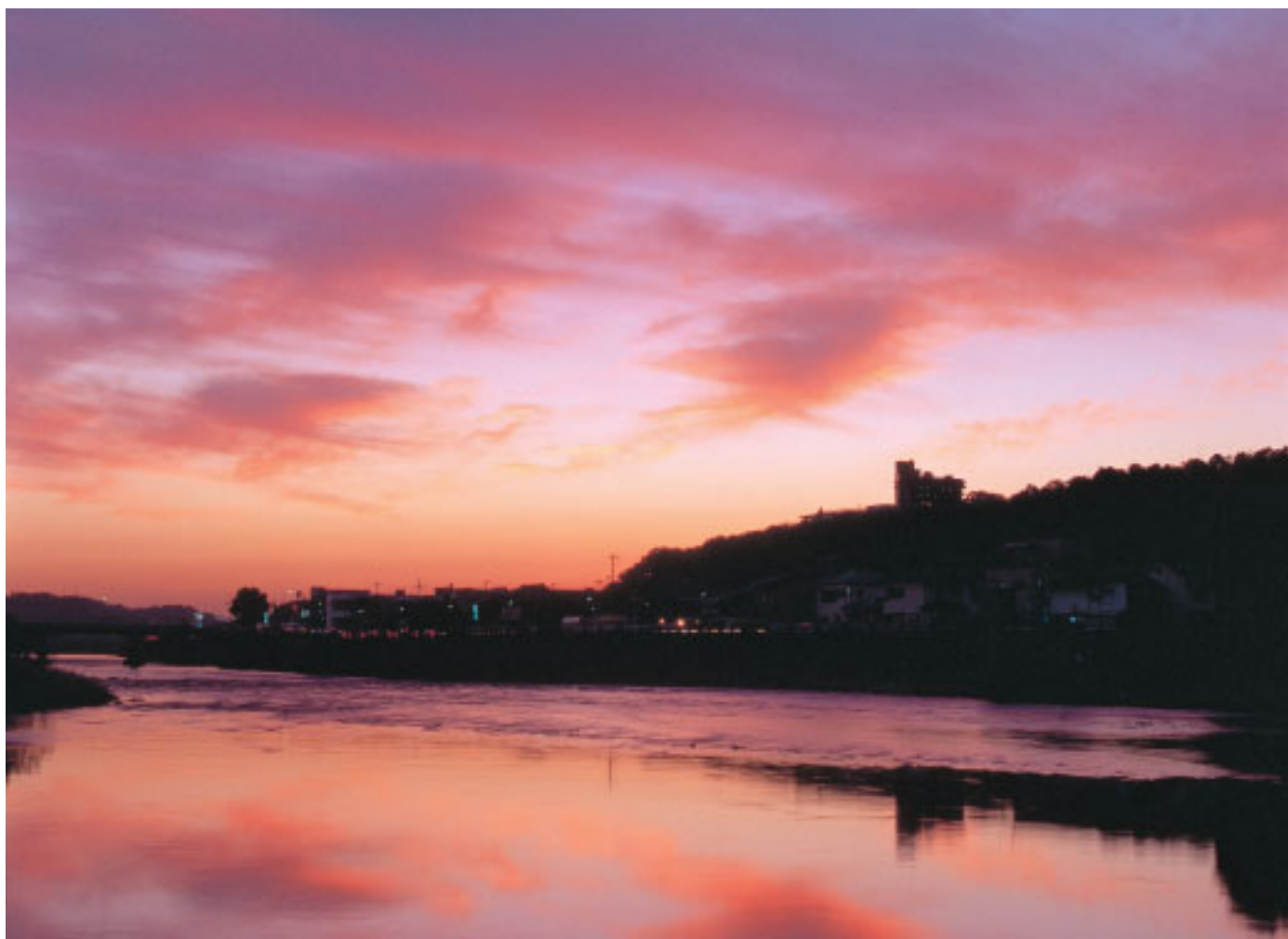
揖保川に映える夕焼。右手奥の丘陵地の建物が赤とんぼ荘