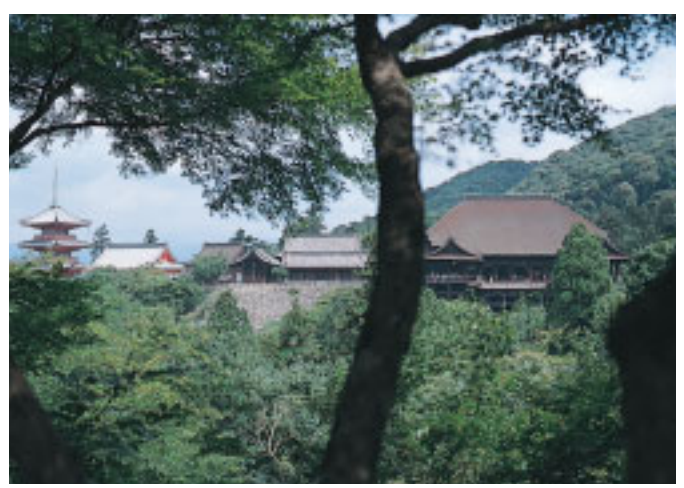
子安塔から望む清水寺の全景