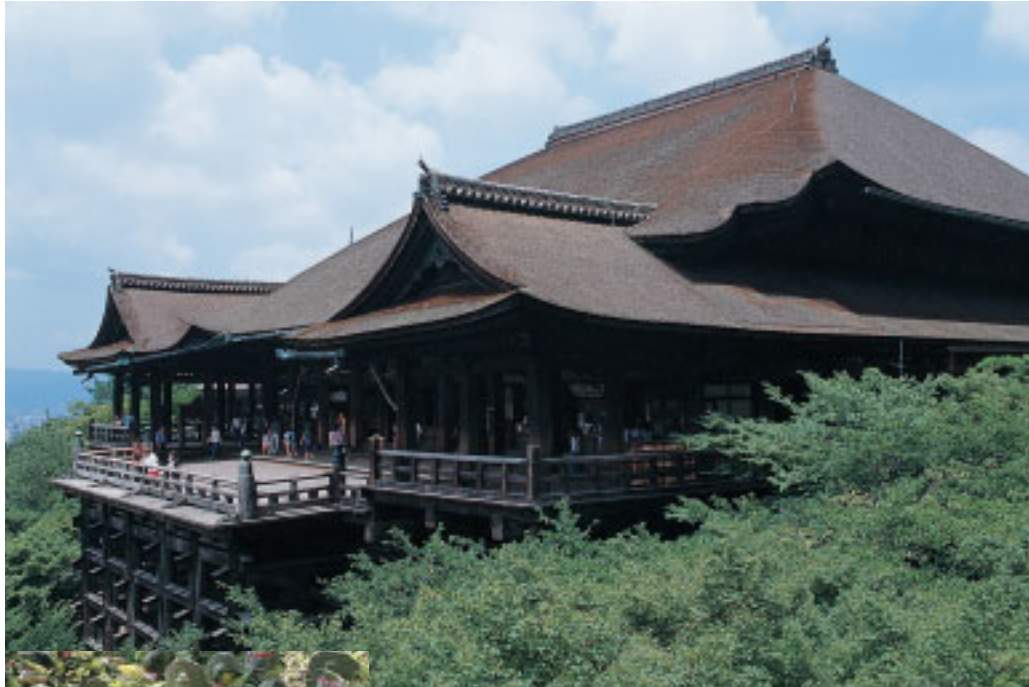
寄棟造り檜皮葺きで裳階と翼廊がついた本堂