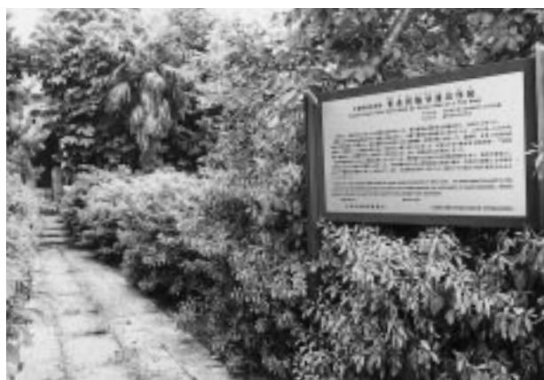
◀幕張踏切の立体交差化完成予想写真。完成後、その上に神社が再建。▲同地にある甘藷試作地の記念碑