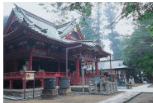
薬王院飯縄権現堂(都指定重要文化財)。薬王院は毎年3月に行われる山伏の荒行の火渡りまつりでも有名です