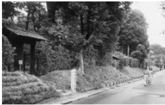
城下町を歩く佐倉カルチャーウォークは関東マーチングリーグ公式大会で、今年で2回目。写真は武家屋敷通り

も可能です。同協会へ入会希望の方は加盟団体(左表)に加入して下さい。 《主なウォーキング予定》 11月10日 ●第8回ウォーキング教室