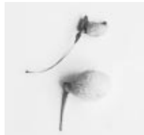
竹岡のオハツキイチヨウの実。大きいものでも親指の爪程度で熟さずにほとんどが落ちてしまいます。下が普通の実