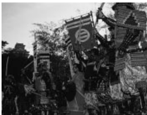
城山公園で出陣式を行う武者行列。左上は館山城

館山の秋の風物詩・南総里見まつりが20回目を迎え、多彩な記念イベントが一週間にわたって開かれます。見所はやはり歴史ロマンを感じさせる里見水軍武者行列(21日)。手作りの甲冑 かっちょう などを身に着けた約200人の市民が例年参加し、市内を練り歩きます。メイン会場の城山公園では郷土芸能の披露や特産品の直売などが恒例となっています。