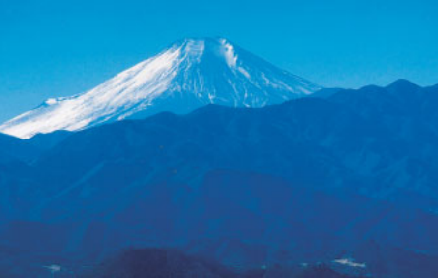
冬場は特に美しい富士山の姿が眺められます