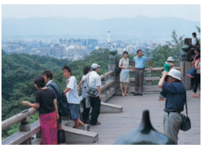
張り出した舞台からは京都市内のほぼ南半分を見渡せます