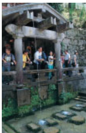
清水寺の名前の由来と もなった音羽の滝