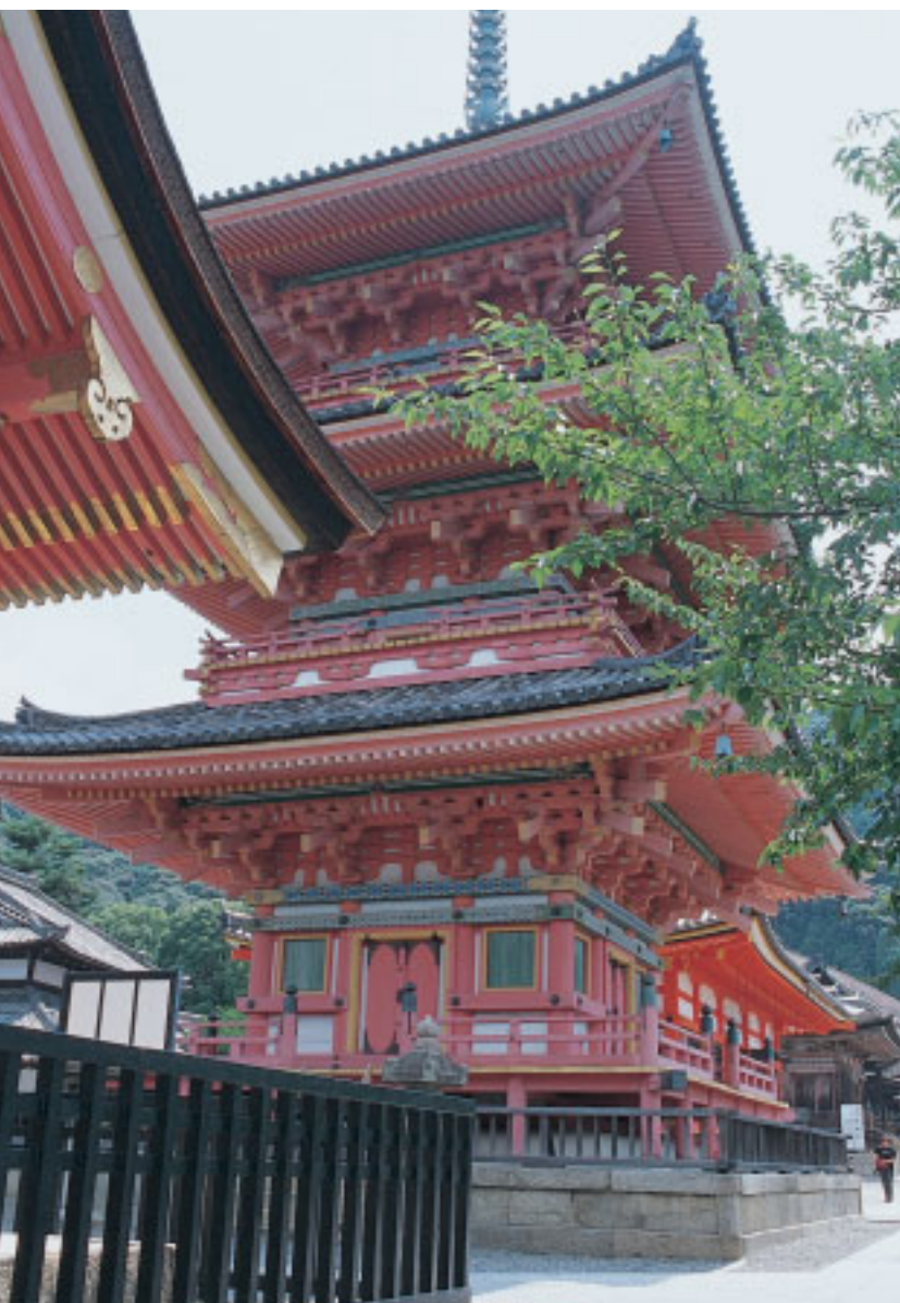
本堂と同時期の寛永年 間に再建された三重塔