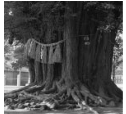
千本イチヨウは根本から多数の支幹が伸びて主幹を囲んでいます